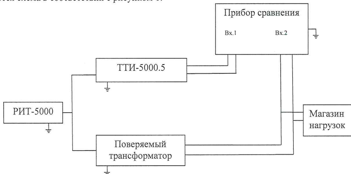
Рисунок 1 – Схема определения токовых и угловых погрешностей трансформаторов классов точности 0,2S; 0,2; 0,5S; 0,5; 1; 3; 5P; 10P; 5PR 10PR

Для трансформаторов классов точности 0,2S; 0,2; 0,5S; 0,5; 1; 3; 5P; 10P; 5PR 10PR собирается схема в соответствии с рисунком 1.