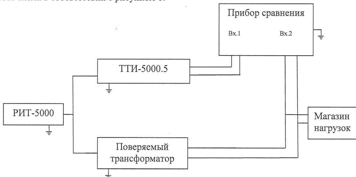
Рисунок 1 – Схема определения токовых и угловых погрешностей трансформаторов классов точности 0,2S; 0,2; 0,5S; 0,5; 1; 3; 5P; 10P; 5PR 10PR

Для трансформаторов классов точности 0,2S; 0,2; 0,5S; 0,5; 1; 3; 5P; 10P; 5PR 10PR собирается схема в соответствии с рисунком 1.