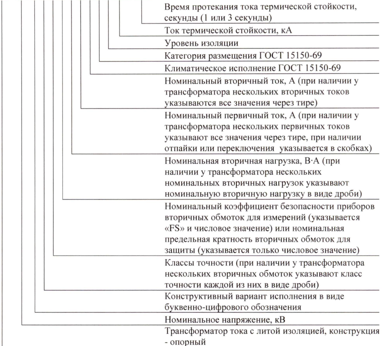
Рисунок 1 – Расшифровка условного обозначения трансформаторов тока