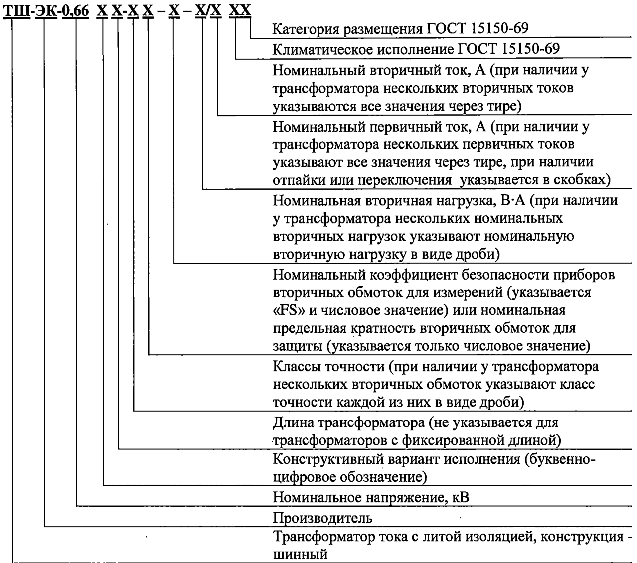
Рисунок 2 – Расшифровка условного обозначения трансформаторов тока